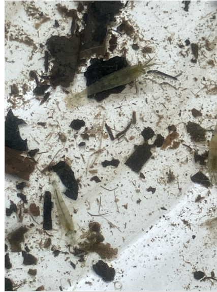
獲った生き物の様子

ひょうたん池は、形がひょうたんに似ていることから名付けられたと言われています。他にも近くには、米を作れる小さな田んぼがあります。